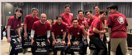
会長の屋号、ウメ印の前掛けとTシャツで お・も・て・な・ひ