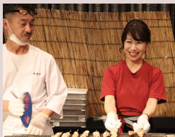
秋の園遊会で供された絶品の焼き鳥