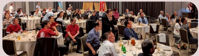
紅林年度を動画で振り返り