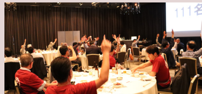
紅林杯テーブル対抗豊橋RC今昔クイズ