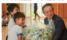
ペットボトルキャップ回収大作戦