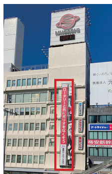
豊橋駅前(豊栄ビル)懸垂幕