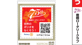
ポリオ根絶創立75周年記念切手