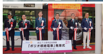
市電「ほつらム」特別ラッピング