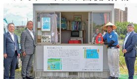
牛川の渡しの看板取付とAED寄贈