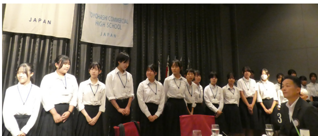
豊橋商業高等学校 I A Cの皆さま

豊橋 R Cの皆さまには、引き続き I A Cの自主的な活動を尊重していただき、ご協力をお願い申し上げます。