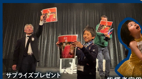
サプライズプレゼント