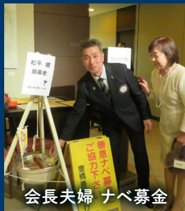
会長夫婦 ナベ募金