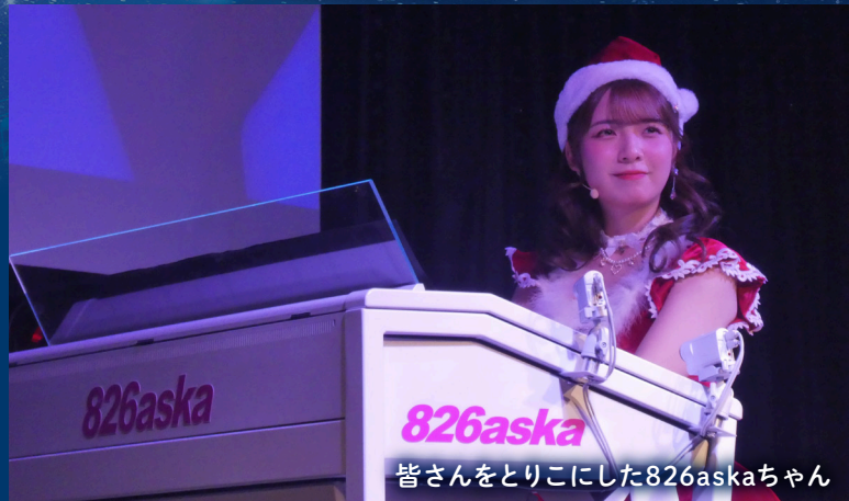
皆さんをとりこにした826askaちゃん