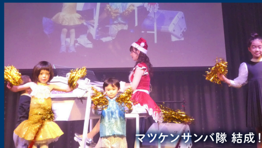
マツケンサンバ隊 結成!