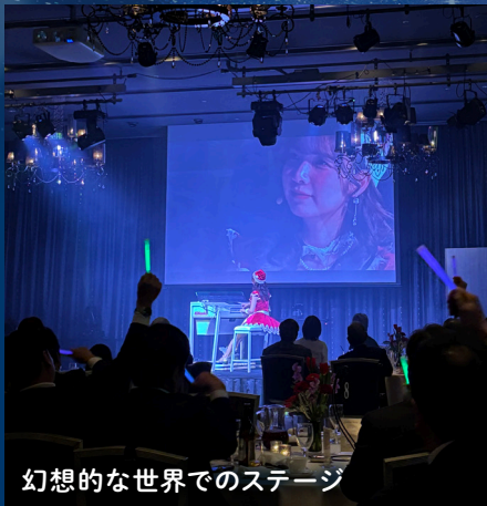
幻想的な世界でのステージ